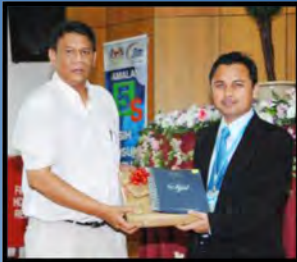
ROZMI BIN ROFLE TEKN. ELEKTRIK