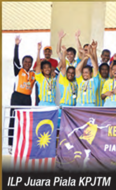
ILP Juara Piala KPJTM