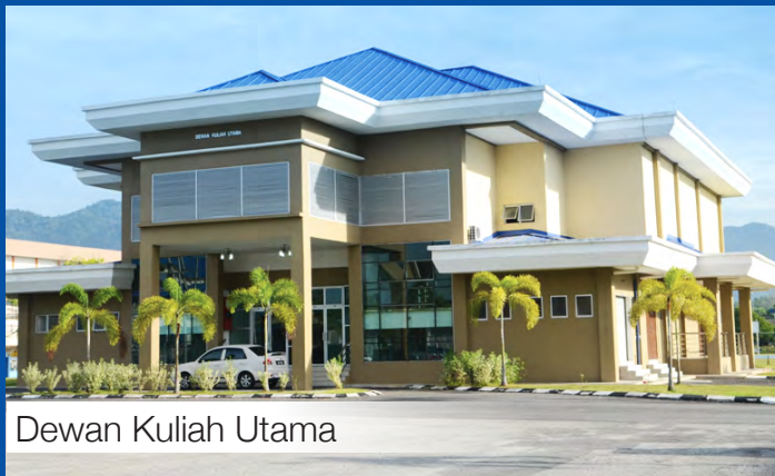
Dewan Kuliah Utama