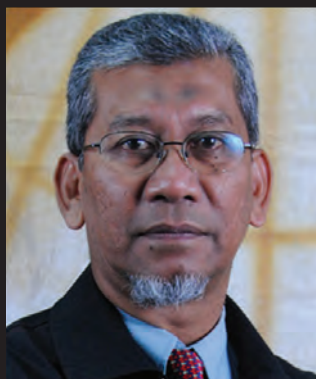
Hamidom Bin Ngah Peg. Lat. Vokasional J44