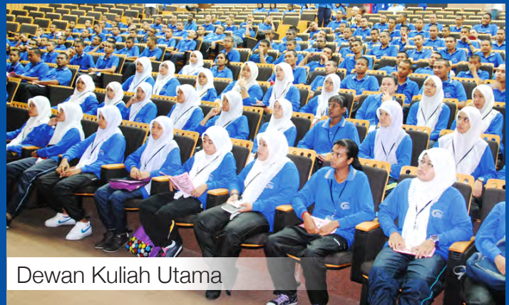
Dewan Kuliah Utama